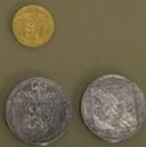
Famétní mince vydané při příležitosti celév 10. výročí vzniku Československa