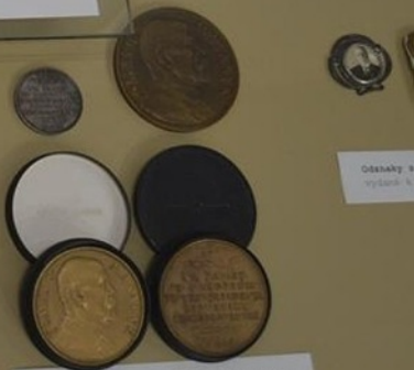
Odtisky s vydaní k