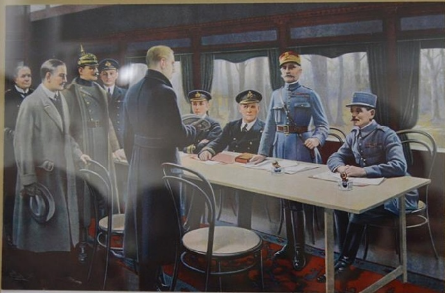
Podepsání příměří v železničním salónním voze v Compiègne dne 11. listopadu 1918 Stojící muž v černém kabátě je Matthias Erzberger, státní sekretář a vedoucí německé delegace. Naproti němu stojí francouzský maršál Ferdinand Foch, který později zastával důležitou roli na pařížské mírové konferenci.