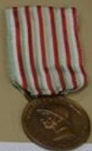
Italská pamětní válečná medaile GUERRA PER L'UNITA 1915-1918 udělována italským legionářům