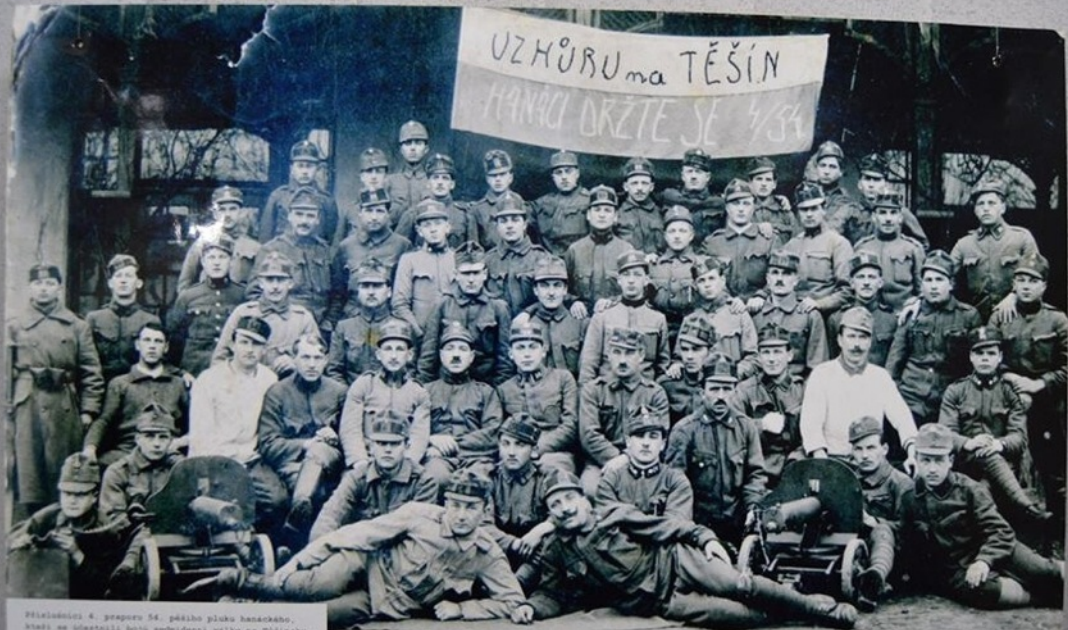
Příslušníci 4. praporek 54. pěšího pluku hanacizano. Stáli se účastníci boje sedmidenní války na Těšínku. V jejich výstroji se nacházely, jak ukazuje snímek, i těžká kulomety Mele.