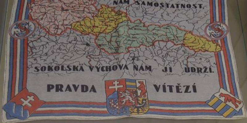
Šátek s mapou 1. republiky hedvábi